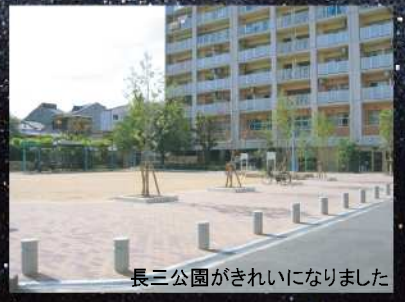
長三公園がきれいになりました

先行受付 直接携帯メールでの「恋文」ご応募もOKです。 200字以内で恋文携帯に送信してください