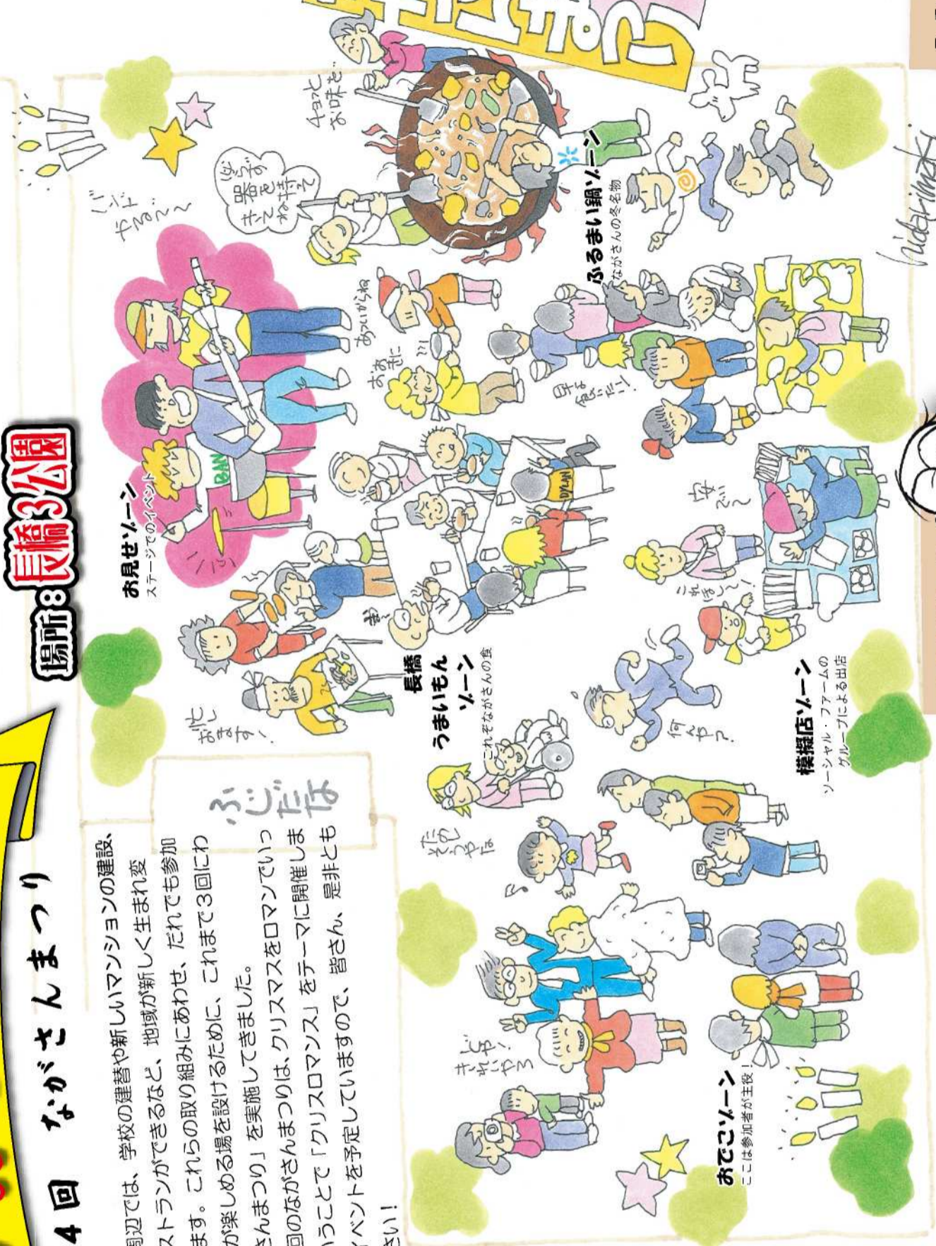
お見せゾーン ステージでのイベント