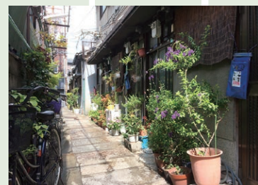
路地に見る玄関先のゆたかな緑

ところで路地を歩いていると、軒先に鉢植えの並ぶ光景をよく目にする。自らの生活に、そして近所にも潤いを少しお裾分け。そこには「義務」なんて窮屈な言葉はなく、お互い様の関係が自然と育まれている。街路樹や公園の緑はスマートに、路地の鉢植えの光景はまたちがった心持ちのゆたかさを匂わせている。自然と異なるまちの緑もまたゆたかだ。（安田拓也）