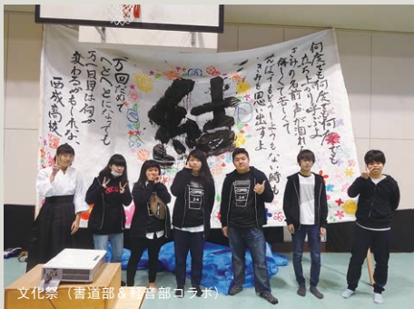
文化祭（書道部と書道部コラボ）

高校生にとって大人との出会いやつながりは、多様な考え方を学ぶことができる絶好の機会です。