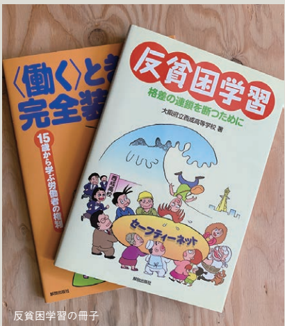
反貧困学習の冊子

ンやつやと思われている」、「自分たちのことをバカにしている」と感じ、教師との信頼関係がない状況でした。そこで「教師だからって何でもわかるわけではない」といい意味で聞き直り、生徒と共に、わからないことはわからないと言