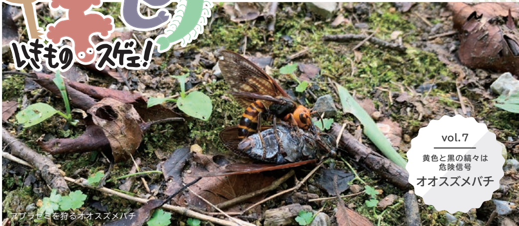
vol.7 黄色と黒の縞々は危険信号 オオスズメバチ