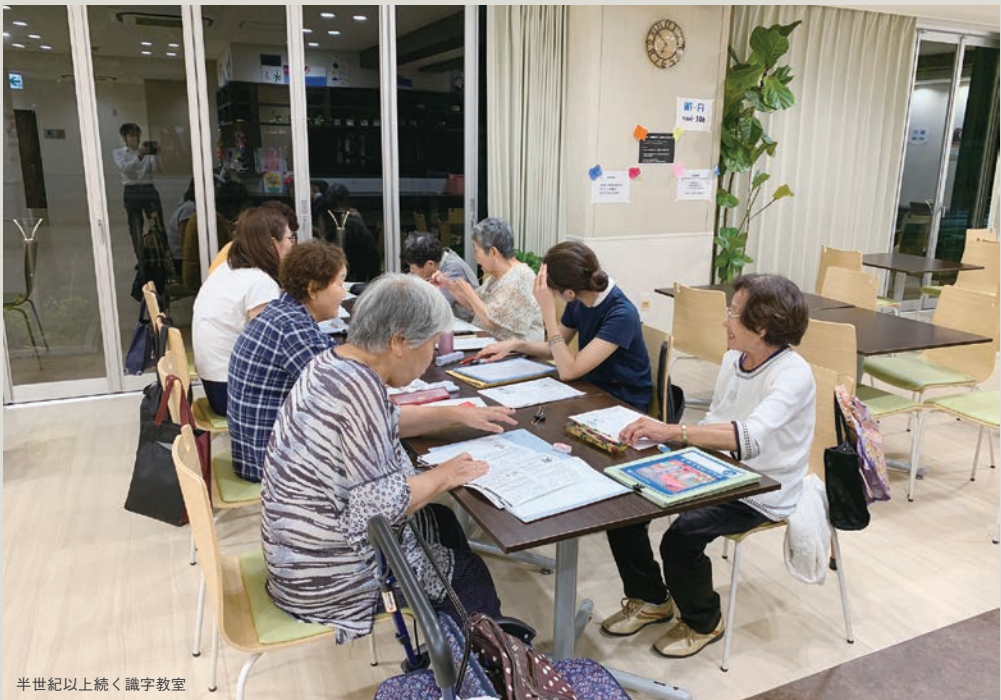
半世紀以上続く識字教室

きいと思います。また、識字教室に來られる方は、何かを学ぼうという意欲が強いので、教える側も力が入ってしまいます。長く続けていくことで、少しずつでも学習者が文字を覚え、変わっていく姿をみるのが、こちらとしても楽しいです。