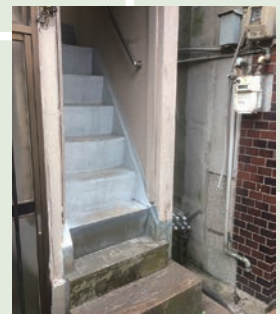
壁のような階段。改修で2階が活きる?

[谷口円]空が真っ暗になる少し前、電車の中から遠くに見える大きなマンション。その半分くらいの部屋にかりが灯っている様子がエモーションナルだなぁと思った初秋のある日でした。