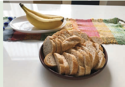
もらったパンをカリッと焼いて、おすそわけ