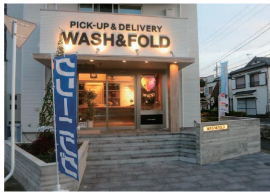
仕事場つきシェアハウス

用ですが、ここは水回り完備の個室と共用リビングというスタイルです。 西 入居者のプライベートを保ちながら、孤独は解消しようという仕掛けですね。ぐるぐる長屋さんも風呂・トイレは別でした。