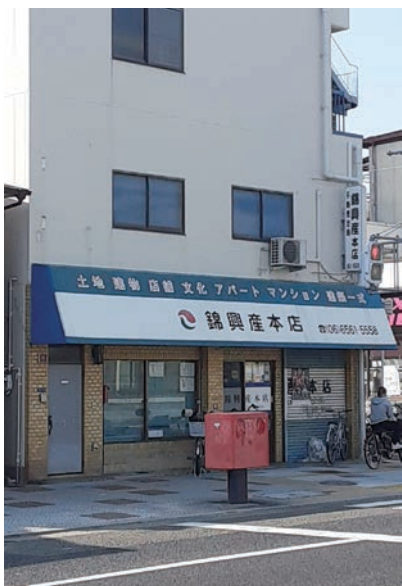
なにわ筋に面する錦興産の店舗

西 外国人学校が一棟まるごと借りて学生寮にするのは、生徒さんに安心住まいを提供するのが狙いなんですか。 松 安いかどうかはわからないです。