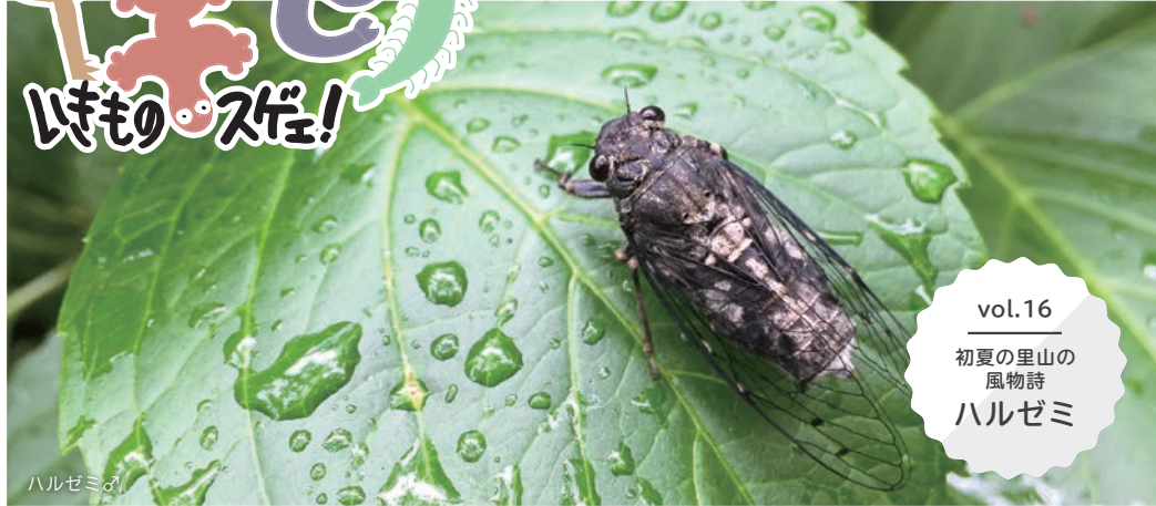
vol.16 初夏の里山の 風物詩 ハルゼミ