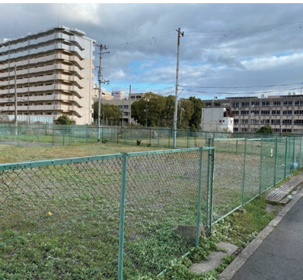
改良が進まず空き地のままの未利用地(長橋2丁目)

松 騒音の問題も多いですね。若気の至りもあります。同郷の間で集まって、夜遅くまで騒いで過ごすことがあるようです。最近では、バイトがなくなった留学生が電気代を節約しようと電球代わりに口ウソクを使ってもありました。とはい