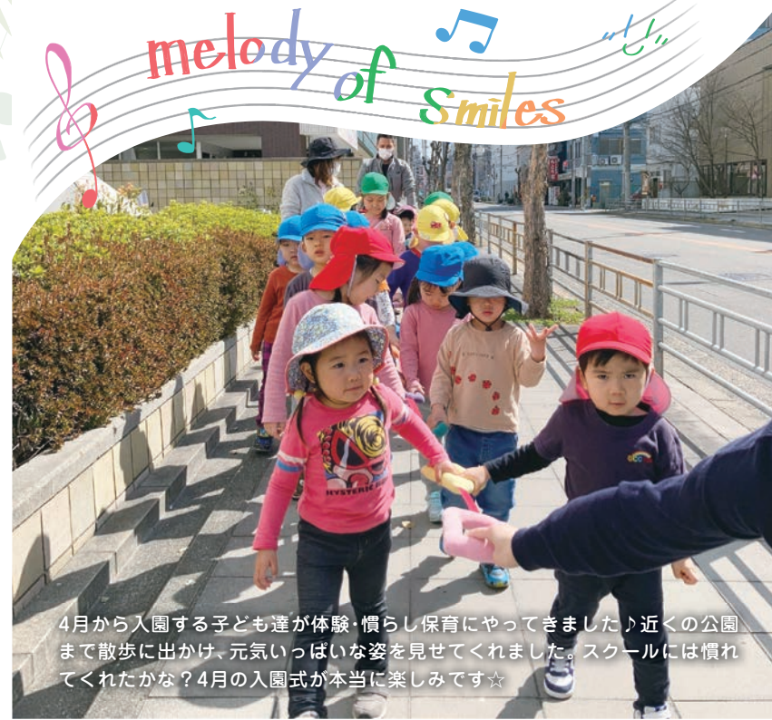
4月から入園する子ども達が体験・慣らし保育にやってきました♪近くの公園まで散歩に出かけ、元気いっぱいな姿を見せてくれました。スクールには慣れてくれたかな？4月の入園式が本当に楽しみです☆

大阪府宮長野公園 〒586-0051 河内長野市末広町581-1 TEL: 0721-62-2772 FAX: 0721-62-2810 https://www.toshi-kouen.jp/staticpages/index.php/nagano_top