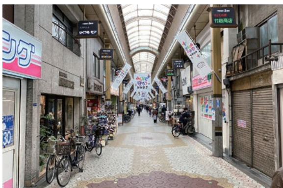
鶴見橋商店街2番街風景 2021年3月撮影

松 コロナで少し落ち着いていますが、 西 ゆくとあいの近くでは、空地ができると戸建ての建売住宅がどんどん建つて、まだまだ元気な印象があります。